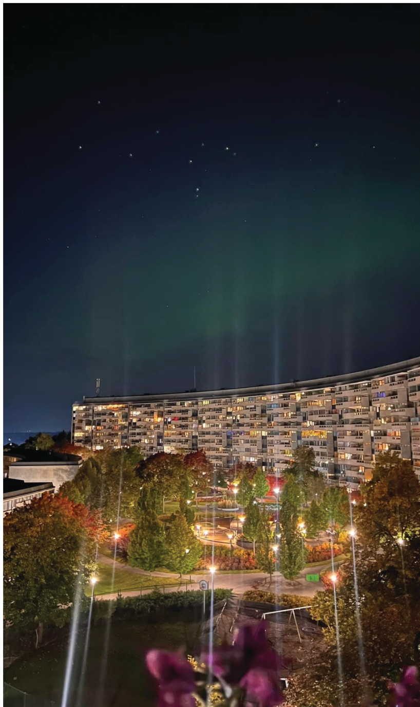
Norrskan över Jupiter