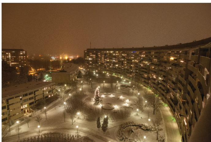
Oktober 2009, med snö